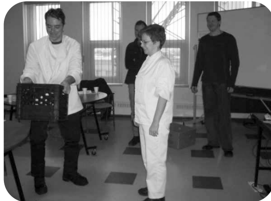
Être capable ou être en sécurité? Questionnement incontournable à se répéter pour soutenir les changements d'habitudes menant à l'adoption de comportements sécuritaires.

Pour ce faire, un comité de pilotage regroupant l'agente de prévention, les chefs de service et un répondant par installation a été mis sur pied. Il s'agissait, pour eux, de faire équipe et de déterminer le contenu de la formation destinée à l'ensemble des employés des