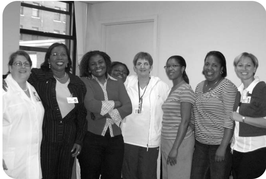
Voici une partie de l'équipe qui a travaillé à ce projet de réorganisation du travail lors d'une activité visant à remercier tous les intervenants.

À J.-H. Charbonneau, en 2007-2008 un projet de réorganisation du travail a été réalisé afin de se doter d'une nouvelle structure de travail permettant aux membres de l'équipe soignante de mieux connaître les besoins des résidents, leurs habitudes de vie, leur histoire de vie et par conséquent de respecter le plus possible leur choix. Cette réorganisation du travail est en lien direct avec l'application du code d'éthique et l'actualisation des principes directeurs d'un milieu de vie de qualité. Cette démarche a été très exigeante pour les infirmières, les infirmières auxiliaires et les préposés aux bénéficiaires qui devaient revoir leur façon de faire et se mobiliser à travailler davantage en équipe; toutefois les résultats obtenus se sont avérés très positifs. Un questionnaire auprès des résidents et des employés interpellés par ce projet a confirmé une amélioration importante de la qualité de vie des résidents et de la qualité de vie des personnes qui les accompagnent, soient les intervenants. Merci à tous.