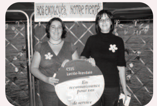
5 ans au Centre d'hébergement Rousselot