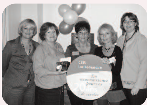
20 ans au CLSC de Hochelega-Maisonneuve