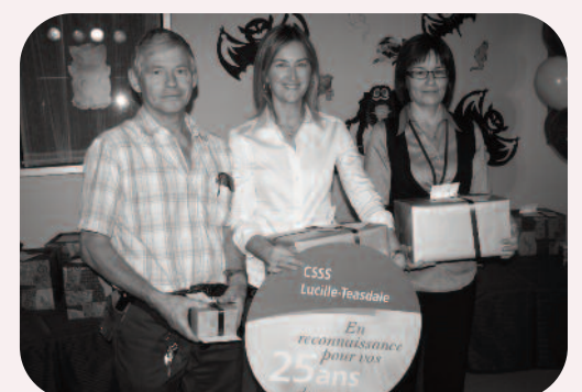
25 ans au Centre d'hébergement Éloria-Lepage