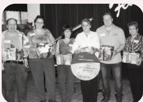
15 ans au Centre d'hébergement Jeanne-Le Ber