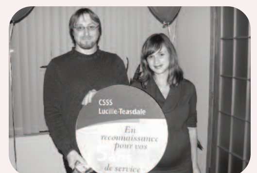
5 ans au Centre de crise de l'Entremise