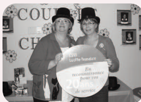
20 ans au Centre d'hébergement Robert-Cliche