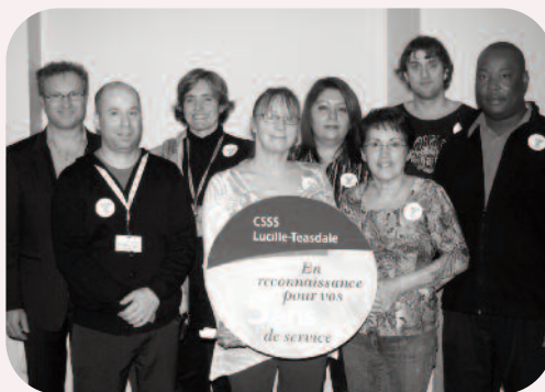
5 années au Centre d'hébergement J.-H.-Charbonneau

Comme le veut la tradition, cet automne, le CSSS Lucille-Teasdale a honoré 336 personnes dans les différentes installations. Ces personnes avaient atteint 5, 10, 15, 20, 25, 30 et 35 ans de service au 31 mars 2010. Toutes les photos « souvenir » sont publiées sur le site intranet. Bravo aux organisateurs de ces célébrations qui ont collaboré à l'achat des cadeaux, à la décoration des salles, à l'installation des buffets et à d'autres activités nécessaires au bon déroulement de ces fêtes. Voici quelques photos prises lors de ces célébrations, l'ensemble d'entre elles sont sur le site intranet.