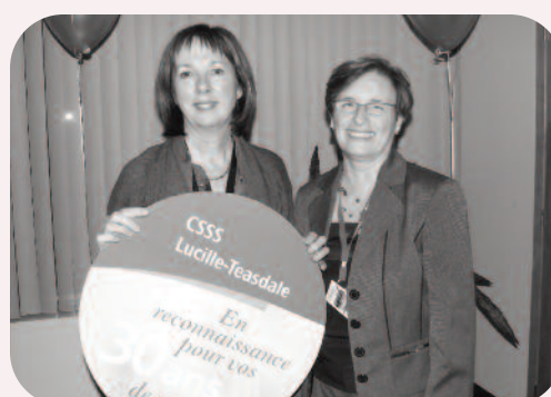
30 ans au CLSC Olivier-Guimond