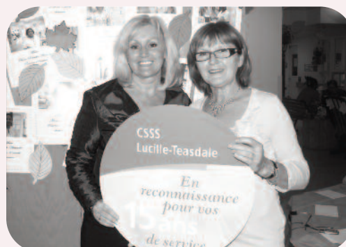
15 ans au Centre d'hébergement Robert-Cliche