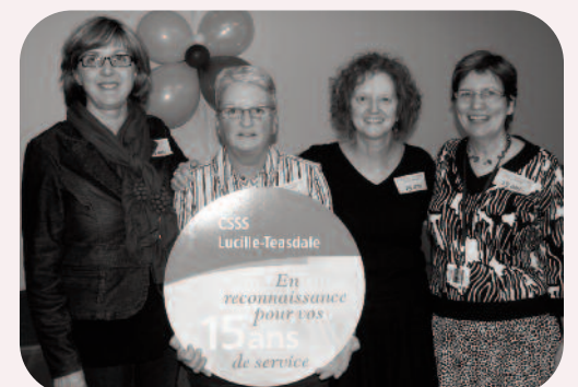
15 ans au CLSC de Rosemont