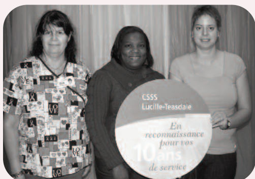
10 ans au Centre d'hébergement de la Maison-Neuve